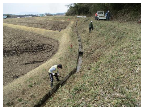
<高瀬 排水路 篠藪刈り>