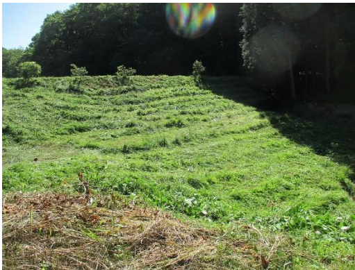
<高瀬 ため池堤体 草刈り>

定期的に農道、水路、揚水機場、ため池等の草刈りを実施するほか、点検・確認の結果に応じ、修繕等が必要な箇所について維持管理作業を行っています。