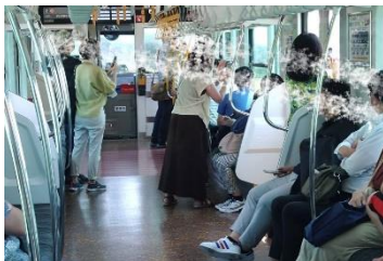
<スマホで写真を撮る乗客>