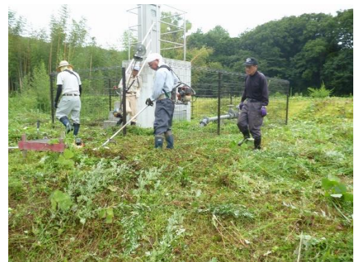
<森田 揚水機場 草刈り>