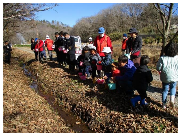
<子供たち、JR 職員、保全会員>