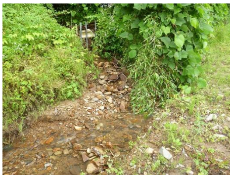
<大里(川原) 排水路整備>

点検・確認の結果、多くの人手が必要であり、単独地区だけで作業することが困難な場合には、ほかの地区からの応援を得て共同作業により維持管理作業を行っています。