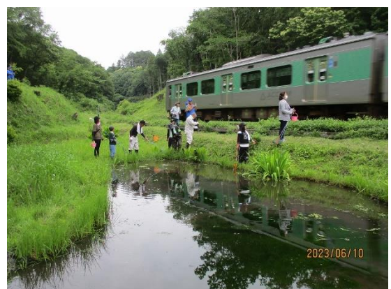
<写真コンクール 優秀賞受賞>