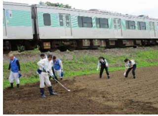
<種まき/JR 車掌さんと保全会員>