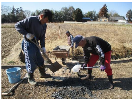
<森田 排水路 修繕>