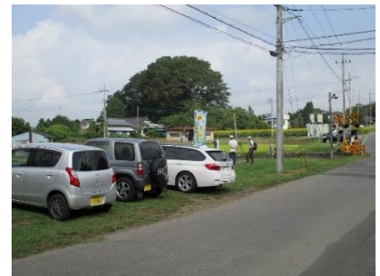
<撮り鉄や家族連れなど多くの来場者>

令和5年度は、生き物調査及びホタルの観察会を開催したほか、ヒマワリの植栽、水芭蕉・シャクナゲ・彼岸花の管理や猿久保田んぼ公園の保安全管理を行いました。