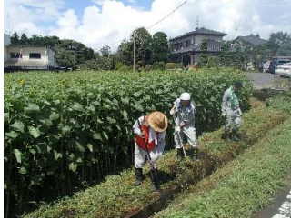
<除草作業/JR 職員、保全会員>