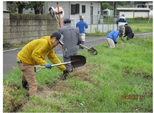
<大里 水路 泥浚い>