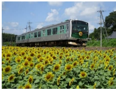
<開業100周年のヘッドマーク>