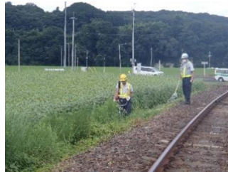
<線路沿いの草刈り/JR 職員>