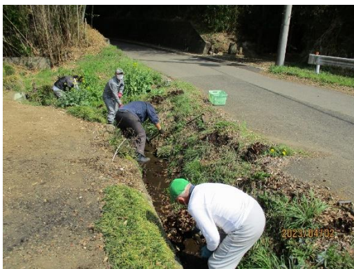
<小埜 水路 泥浚い>